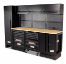
516 SA/STL - Arredamento per officina postazione standard - pianale in legno