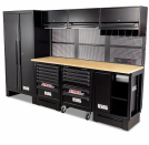
516 SA/PRL - Arredamento per officina - pianale in legno