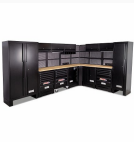
516 SA/CTL - Arredamento per officina - pianale in legno